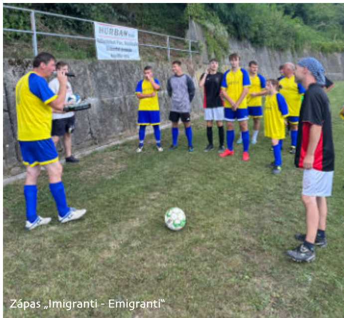
Zápas „Imigranti - Emigranti“