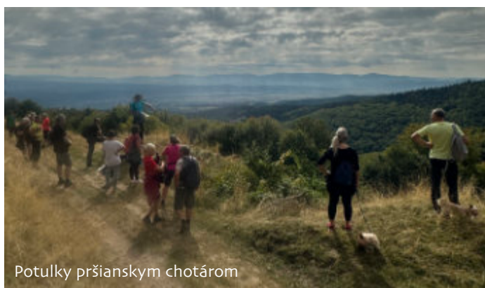
Potulky pršianskym chotárom